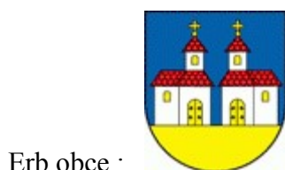
Erb obce :